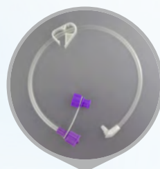
Zestaw przedłużający danumed® do gastrostomijnej sondy niskoprofilowej danuButton®