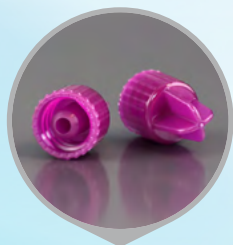
Zatyczka do strzykawki enteralnej danumed®