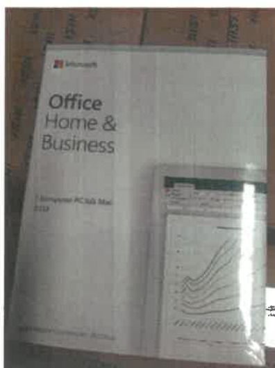
Rys. 3 Przykładowe zdjęcie pudełka dla produktu Microsoft Home&Business

Jesteśmy przekonani, że dzięki takiemu zapisowi do wzoru umowy Zamawiający otrzyma od potencjalnego Wykonawcy w pełni oryginalne oprogramowanie zgodne z warunkami licencjonowania producenta oprogramowania.